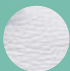
Mod. 100 BLANCO