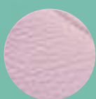
Mod. 102 PÉTALO