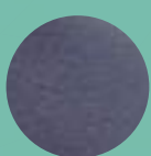
Mod. 101 AZUL