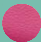
Mod. 103 ORQUÍDEA