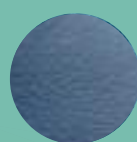
Mod. 104 ZAFIRO