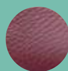
Mod. 106 BALI