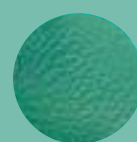
Mod. 105 VERDE